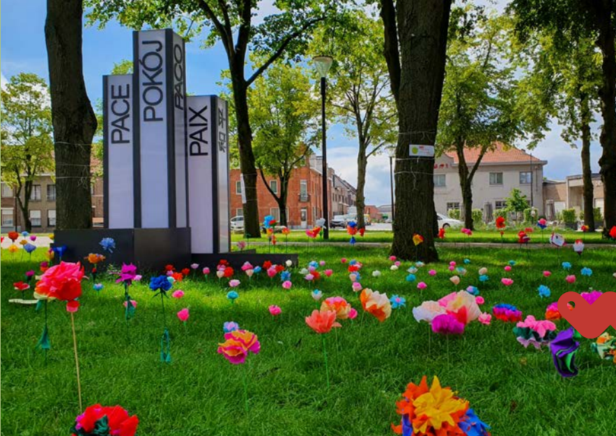
Vredeskunstwerk in Langemark met bloemen ter herdenking van de gestorven vluchtelingen op de Middellandse Zee op de dag van de vluchteling 20/06/2021.

In het kader van de Vredesweek 2018 slaagden we er in om 33.328 origami-kraanvogels te plooien en om die te gaan afgeven op het kabinet van de Eerste Minister. De kraanvogels die symbool staan voor de hoop op een vreedevolle toekomst moesten onze oproep ondersteunen om meer te investeren in Vrede.